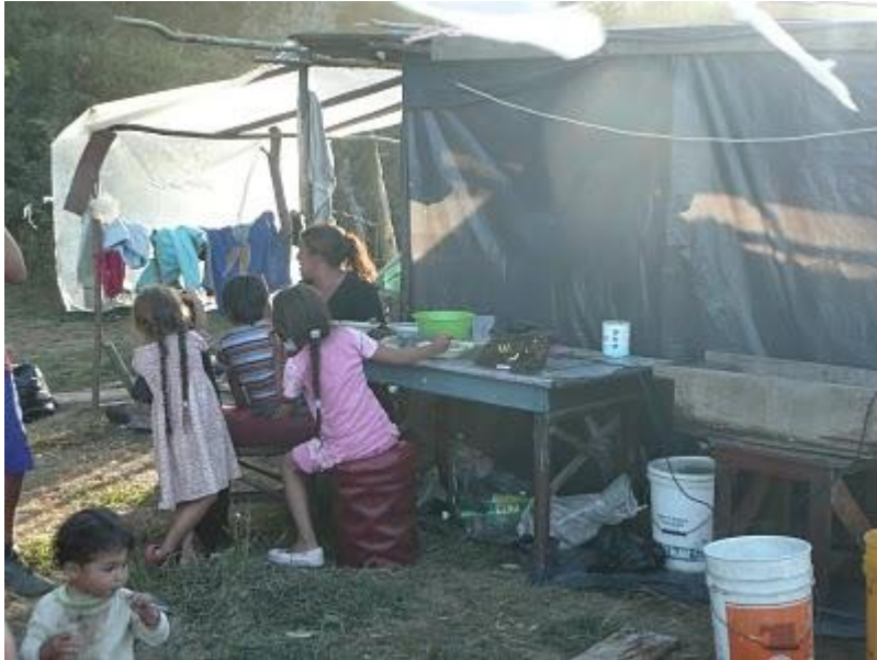
FOTOGRAFIAS ACTIVIDADES CON POBLADORES